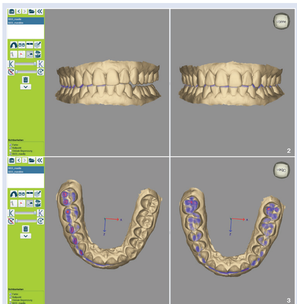
Abb. 2: Splitscreen in CONTACT. Links: vor der automatischen Korrektur. Rechts: nach der automatischen Korrektur. – Abb. 3: Links: farbige Kontaktpunkte vor der automatischen Korrektur. Rechts: farbige Kontaktpunkte nach der automatischen Korrektur.