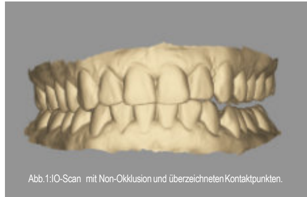
Abb.1:IO-Scan mit Non-Okklusion und überzeichneten Kontaktpunkten.

Wer in der Zahntechnik arbeitet, kennt das Drama aus der anderen Perspektive bzw. am anderen Ende der digitalen Übertragungskette: Der Scan kommt, die Freude über einen reibungslosen Workflow ist groß – bis man die Okklusion prüft. Rechts klafft der Biss wie ein Spalt in der Matrix, links graben sich Höcker in das Modell wie High Heels ins Parkett um Mitternacht. Mit geschultem Auge sprechen viele Zahn-techniker inzwischen von einer Fehlerquote von rund 20 Prozent bei digitalen Bissnahmen. Die bisherige Lösung führt oft über den kostspieligen Rückweg: Rücksprache mit der Praxis, erneuter Patiententermin, erneutes Scannen – ein zeitintensiver und ressourcenfressender Kreislauf. Damit soll jetzt Schluss sein.